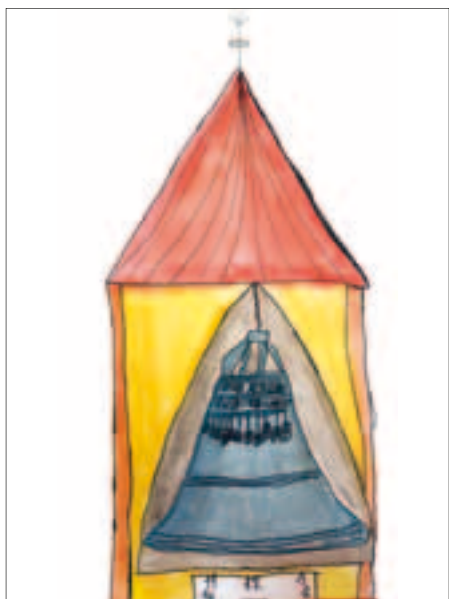
L. Suková 4. A Věž evangelického kostela