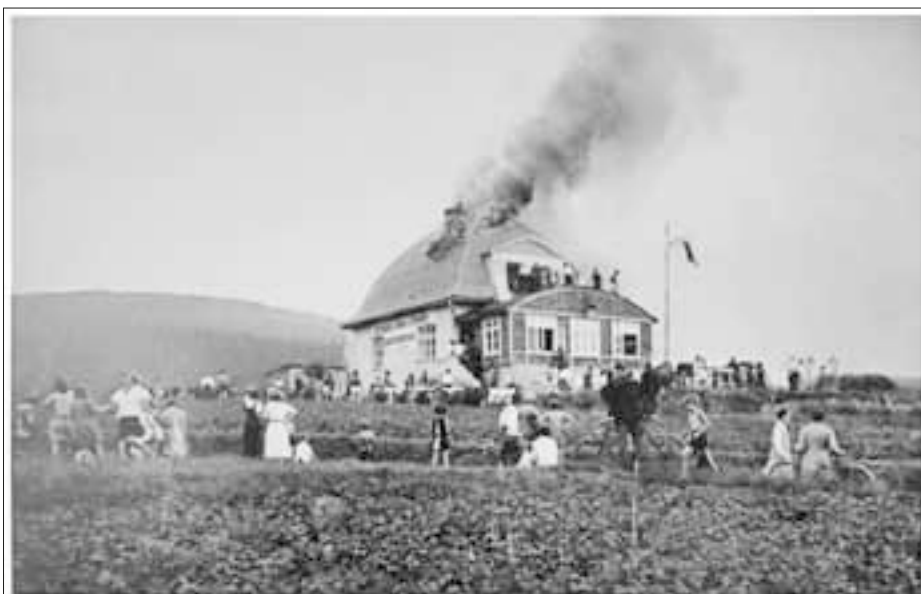
Chata U Kyselky v Novém Městě pod Smrkem