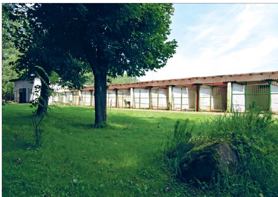
▲ Útulek pro psy Hajniště (více na straně 2)