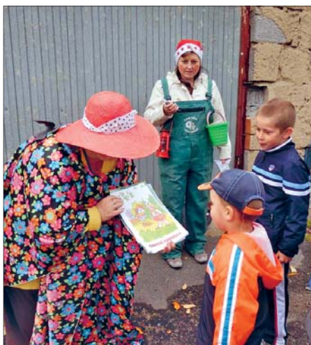
▼ MŠ připravila pro děti „Pohádkový les“ (více na straně 14)